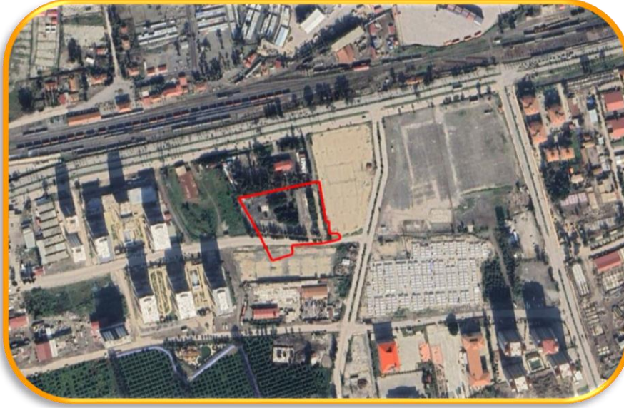
Şekil 2: Mülkiyet Durumu

Planlamaya konu taşınmaz Hatay İli, İSenderun İlçesi, Aşkarbeyli Mahallesi, 5797 Nolu parselde yer almaktadır. Planlama Alanı 12.560,91 m 2 büyüklüğündedir. Taşınmaz üzerinde herhangi iki adet yapı bulunmaktadır.