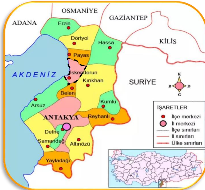
Şekil 1: Çalışma Alanının Bölge İçindeki Yeri

Kara, deniz ve hava ulaşımına elverişli bir kenttir. İlçe topraklarının kuzeyinde Payas, doğusunda Amanos Dağları, güneydoğusunda Belen, güneyinde Arsuz ve batısında Akdeniz bulunur. İskenderun Körfezi ise Akdeniz'in Hatay ve Adana illeri arasında kalmış olan en doğu noktasıdır. Kara ve deniz ulaşımında hizmetlerin oldukça gelişmiş olduğu bölgede ticaret büyük öneme sahiptir. Adını aldığı İskenderun ilçesinde bulunan liman, Türkiye'nin Akdeniz kıyısında bulunan en büyük ikinci limanıdır. İskenderun Körfezi, Hatay'ın batısını Güvercinkaya'dan başlayarak Yeşilkent'e dek kuşatır. Körfez ilde yaklaşık 152 km'lik bir kıyı oluşturur.